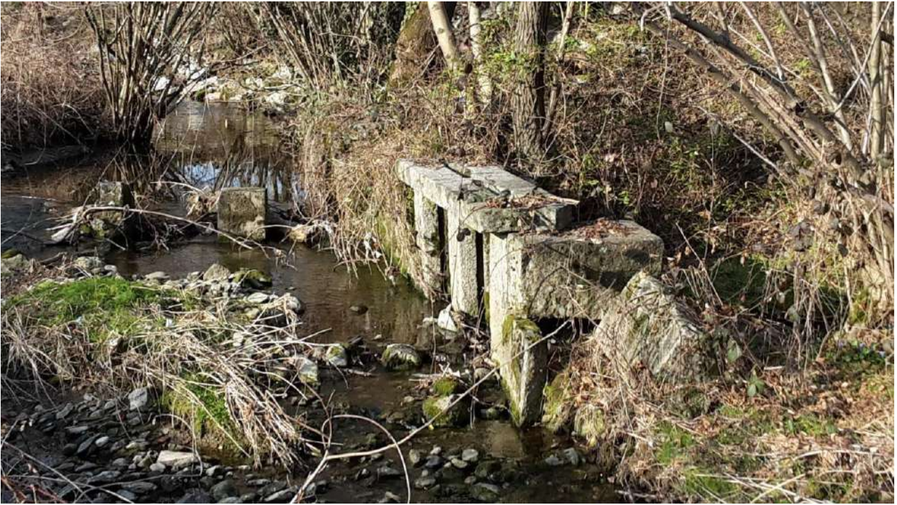
Fig.6 Confine Nord – Fosso Rese