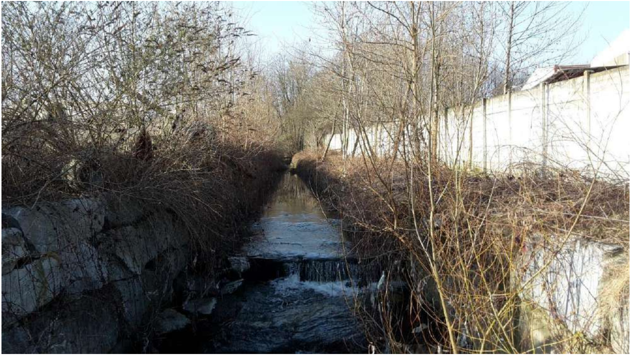
Fig.4 Confine Est - Fosso Rese