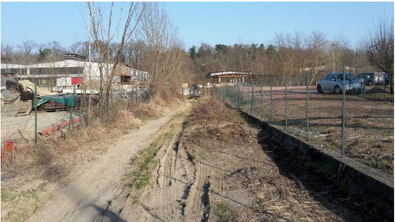
Fig.4 Strada fra differenti proprietà