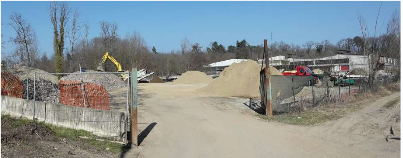
Fig.3 Accesso all'area di proprietà Arona Scavi