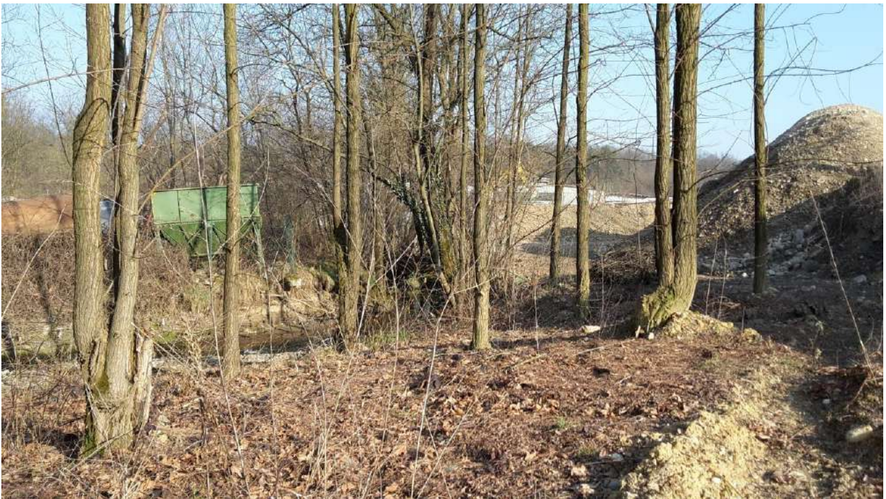
Fig.5 Confine Nord – Fascia di rispetto fosso Rese