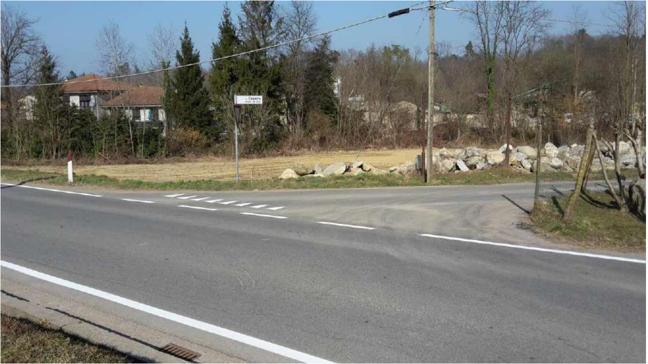
Fig.1 Incrocio con via Ceserio