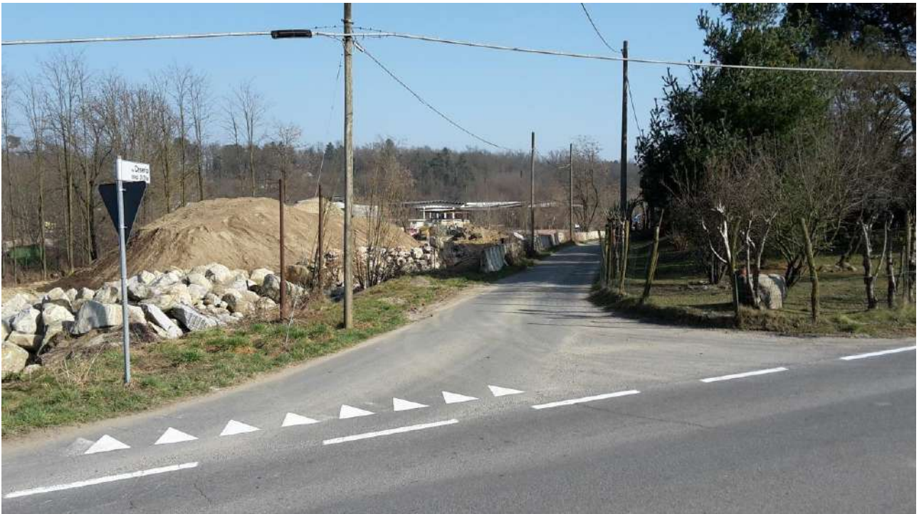
Fig.2 Incrocio con via Ceserio – Strada di accesso alla proprietà